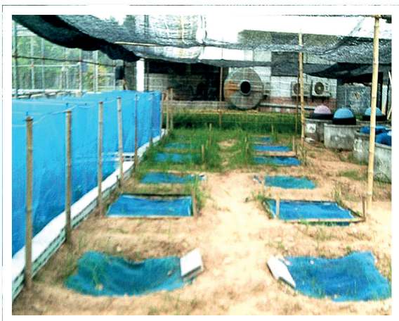
ภาพที่ 9 บ่อหลุม