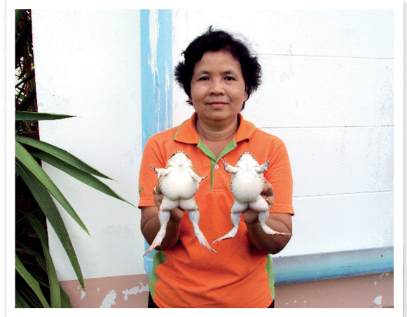
ภาพที่ 4 สีผิวหนังกบด้านท้อง