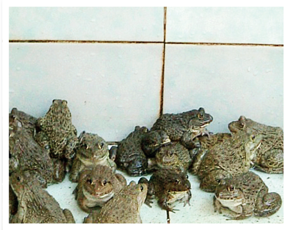
ภาพที่ 1 กบลูกผสม ฟอกบนา