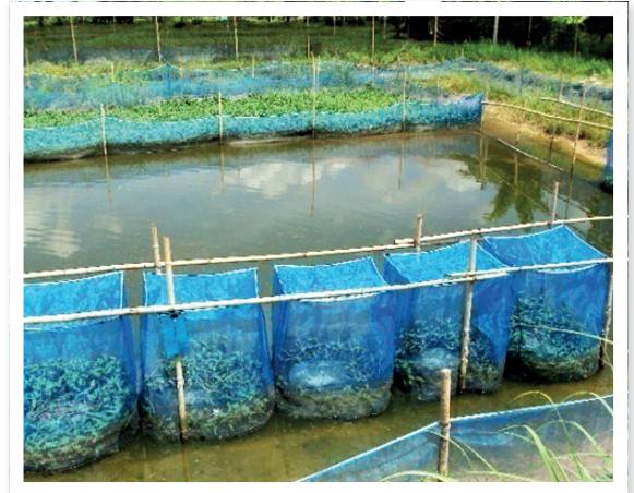
ภาพที่ 5 บ่อกระชัง