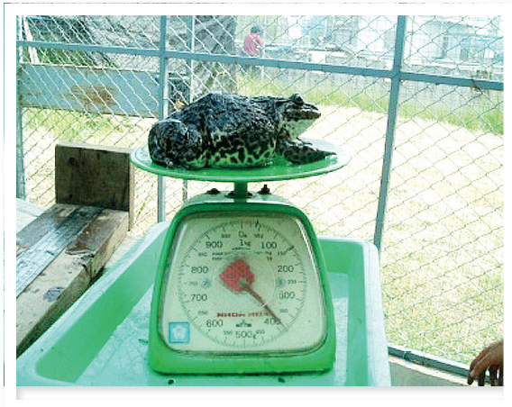
ภาพที่ 11 น้ำหนักบลูกผสม 3 สายเลือดที่เกิดจากพ่อกบนา