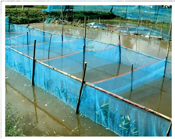
ภาพที่ 8 บ่อดิน