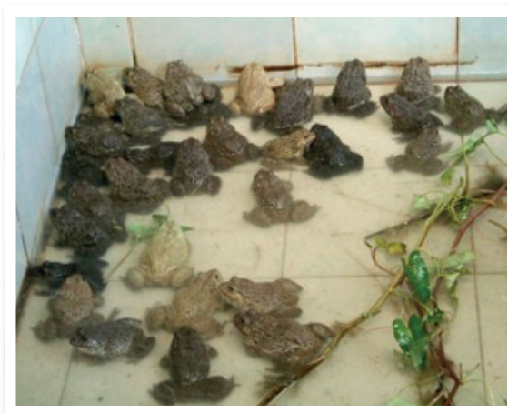
ภาพที่ 3 บ่อซีเมนต์ปูกระเบื้องแผ่นเรียบ