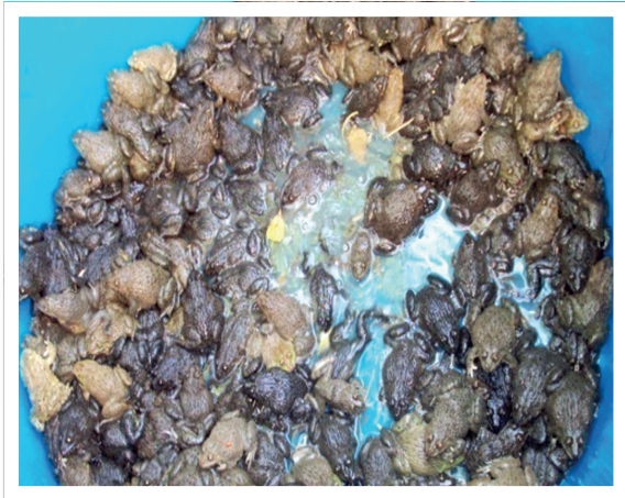
ภาพที่ 7 กบที่เลี้ยงในบ่อคอนกรีต