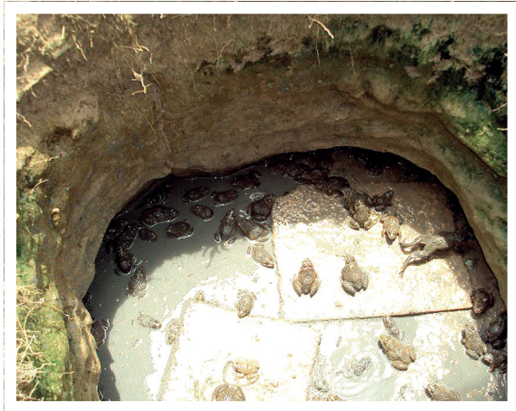
ภาพที่ 10 กบที่เลี้ยงในบ่อหลุม