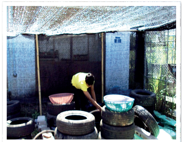
ภาพที่ 6 บ่อคอนโด