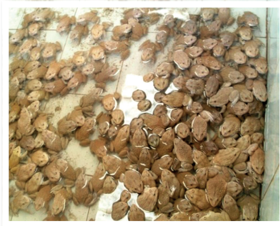
ภาพที่ 2 กบลูกผสม ฟอกบจาน