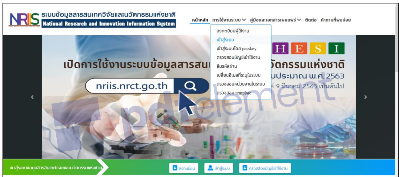
รูปที่ 1 หน้าเข้าสู่ระบบ